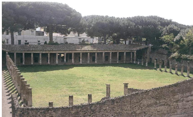
Εικ. 3. Το δεύτερο ludus της Πομπηίας (62-79 μ.Χ.)

τον θάνατο με «όσο το δυνατόν λιγότερο θόρυβο». 54 Για την τιμωρία των πειθαρχικών παραπτώματων πολλά ludi , όπως αυτό της Πομπηίας, διέθεταν μικρά δωμάτια απομόνωσης, όπου ο έγκλειστος δεν μπορούσε να τεντώσει πλήρως τα μέλη του ή να σηκωθεί τελείως όρθιος. 55