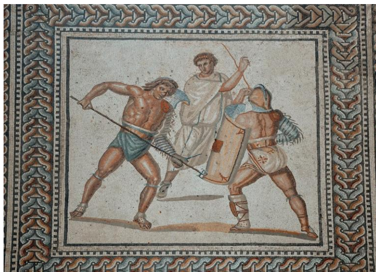
Εικ. 2. Ψηφιδωτό του 3 ου αιώνα μ.Χ. με στιγμιότυπο μονομαχίας ανάμεσα σε έναν retiarium κι έναν secutorem . Πιο πίσω ο summa rudis (παλαιίμαχος μονομάχος – διαιτητής) επιβλέπει τον αγώνα (Nennig, Γερμανία).

έμπειρους μονομάχους ( veterani ) που ανήκαν σε έξι διαφορετικές armaturas , η δεύτερη είχε αρχηγό έναν veteranum ενώ οι άλλες δύο απαρτιζόνταν από εκπαιδευόμενους ( tirones ). 43