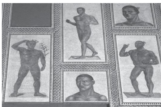
Εικ. 5. Παραστάσεις μονομάχων σε ψηφιδωτό από τις θέρμες του αυτοκράτορα Καρακάλλα (212-216 μ.Χ.) (Futrell, 2006, σ. 136).

Η αναγνώριση που είχαν οι μονομάχοι στις τάξεις του λαού δεν ήταν επωφελής μόνο για τους ίδιους αλλά και για τους επιμελητές των munerum , καθώς τα πλήθη συνέρρεαν στις διοργανώσεις τους για να παρακολουθήσουν τους ήρωές τους να μάχονται στην αρένα. Ο munerarius Κωνστάντιος από την Τεργέστη τίμησε δυο μονομάχους οικοδομώντας τον τάφο τους καθώς ο θάνατός τους συνέβαλε στην επιτυχία των αγώνων του. 77 Όπως σημειώνει ο J.A. Stevens σχολιάζοντας το εύρημα «αυτό αποδεικνύει ότι μερικές φορές, ακόμη και για τα ανώτερα στρώματα της ρωμαϊκής κοινωνίας, οι (σ.σ. ικανότεροι) μονομάχοι δεν ήταν απλώς κοινωνικά αόρατες υπάρξεις. Το ταλέντο και τα κατορθώματά τους στην αρένα τους προσέδιδαν ένα βαθμό «νομιμοποίησης», όπου η αξία τους μπορούσε να αναγνωριστεί και να επιβραβευτεί από τη ρωμαϊκή εξουσία». 78